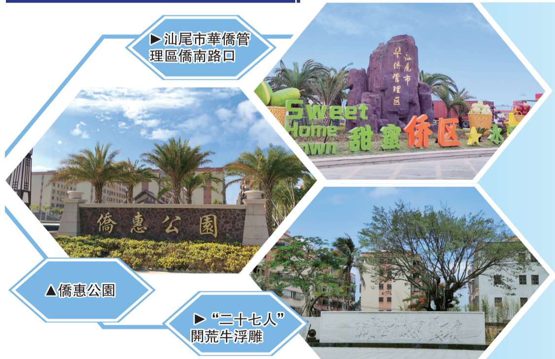
▶ 汕尾市華僑管理區僑南路口